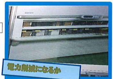
電力削減になるか